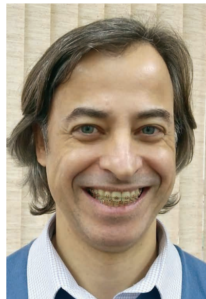
Matias: “Os valores de transporte e alimentação, desde que dados na forma e rigor da lei, também poderão ser excluídos da base de cálculo”